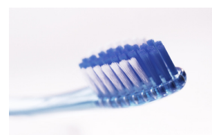
Hygiène & Parapharmacie