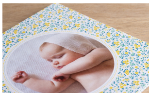
Faire-part de naissance