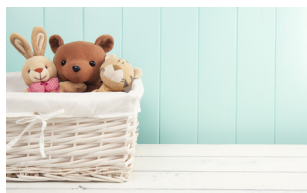
Cadeaux & jouets