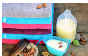
Blanchisserie & Pressing